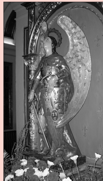
¡A ti acudimos...!

Del olvido de Dios, libranos. De las guerras, libranos. De todo mal, libranos. Ayúdanos, protégenos y sálvanos.