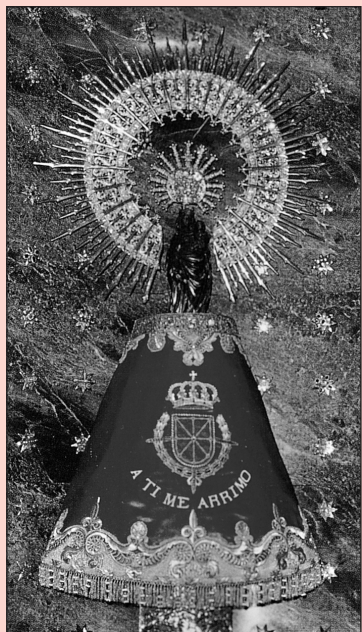
¡Bendita y alabada sea la hora...!

Ángel Custodio de España, tan olvidado. A ti acudimos en estos tiempos difíciles. Dios te ha encomendado la misión de ser nuestro Protector y Defensor en el peligro. Te imploramos para que nos guíes en medio de las tinieblas de los errores humanos y seas nuestro escudo protector ante los enemigos exteriores e interiores de nuestra Patria, alcancemos la reconquista de la Unidad Católica de España y podamos ver la restauración del Reinado Social del Sagrado Corazón de Jesús, y de esta forma España vuelva a ser el paladín de la Fe Católica. Ángel Custodio de España: